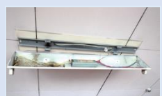
変圧器・コンデンサー・安定器など